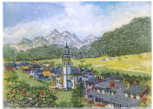
A-78 セストⅡ, ドロミテ(イタリア) 《エッチング+手彩色》