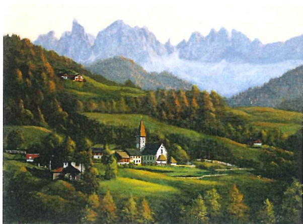
P8-01 フネスⅡ,ドロミテ 《キャンバスジグレー+メディウム仕上げ》