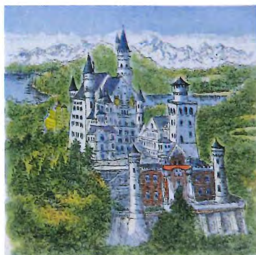
M15-19 ノイシュバンシュタインXXⅦ 《エッチング+手彩色》