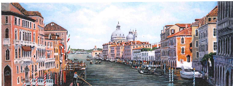
F4W-01 ザ・ベニスⅩⅤ 《キャンバスジグレー+メディウム仕上げ》