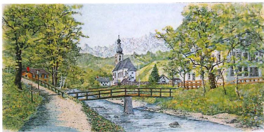
H-12 ベルヒテスガーデンⅦ (ドイツ) 《エッチング+手彩色》