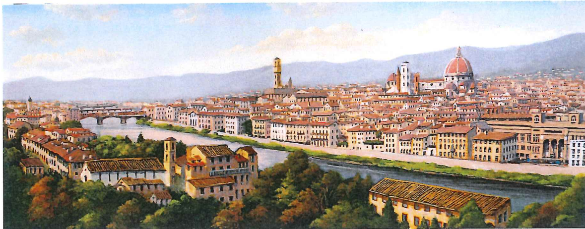
F6W-01 フィレンツェⅣ 《キャンバスジグレー+メディウム仕上げ》