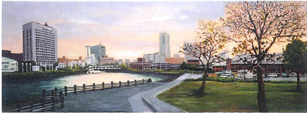
F4W-02 みなとみらいⅡ 《キャンバスジグレー+メディウム仕上げ》