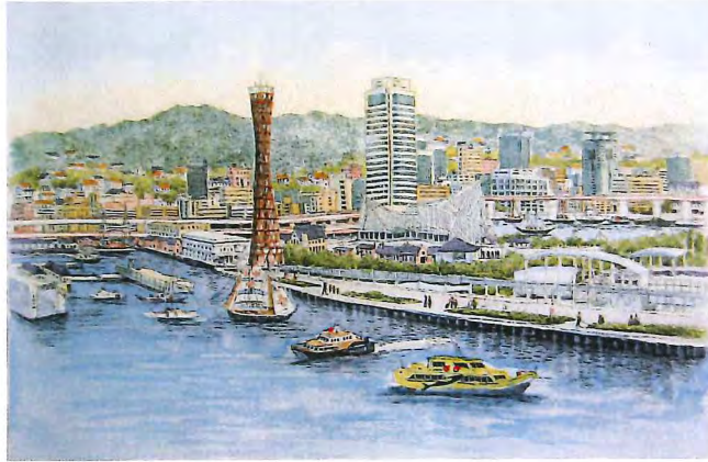
G-11 ハーバービューⅣ 《エッチング+手彩色》