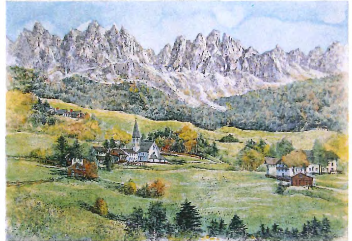
CA-49 フネス, ドロミテ (イタリア)