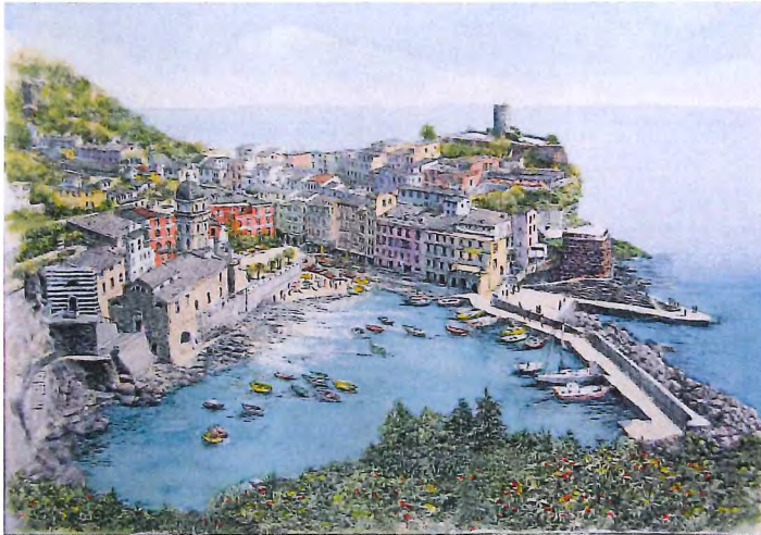
CA-48 チンクエッテ (イタリア)