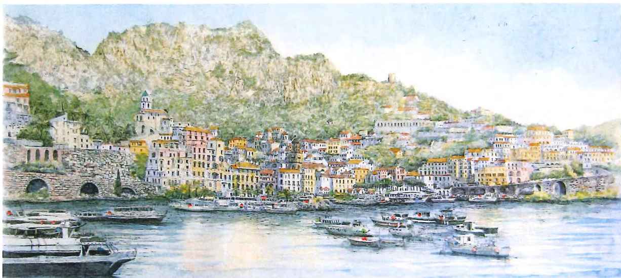
J-07 アマルフィー (イタリア) 《エッチング+手彩色》