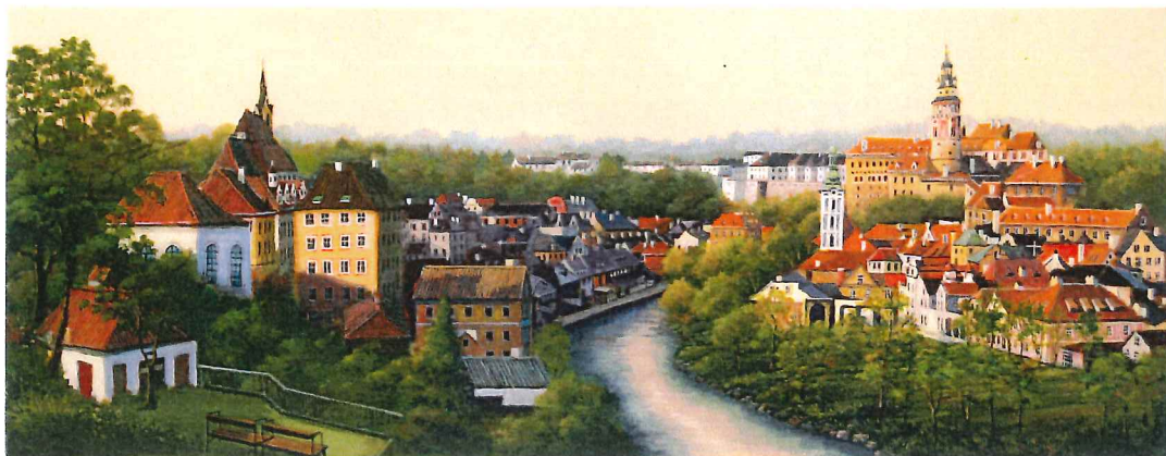
F6W-03 チェスキークルムロフⅥ 《キャンバスジグレー+メディウム仕上げ》