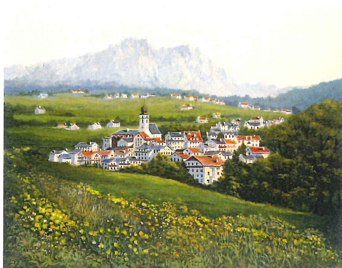
P10-02 シーリアル,ドロミテ 《キャンバスジグレー+メディウム仕上げ》