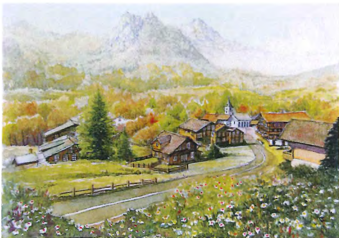
CX-13 グリンデルワルドV (スイス)