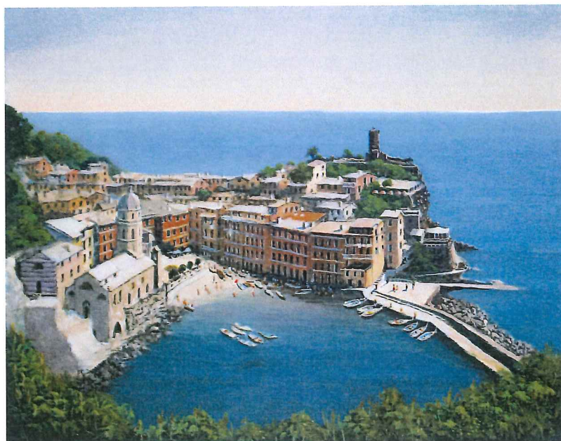
P10-01 チンクエッレⅡ 《キャンバスジグレー+メディウム仕上げ》