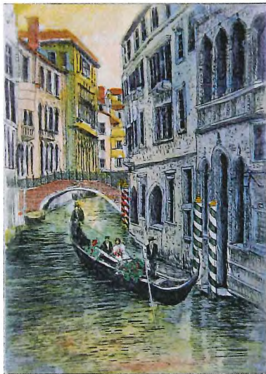
A-77 ベニスの結婚式Ⅴ(イタリア) 《エッチング+手彩色》