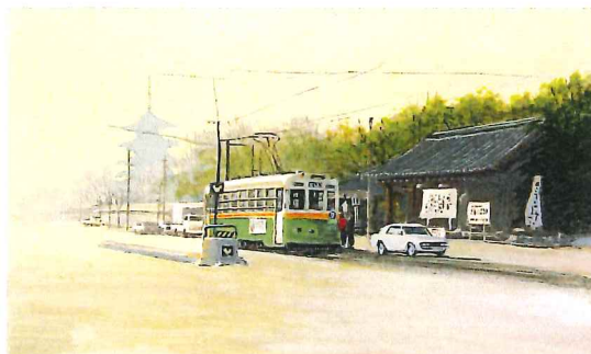
M6C-01 京都市電,東寺 《キャンバスジグレー+メディウム仕上げ》