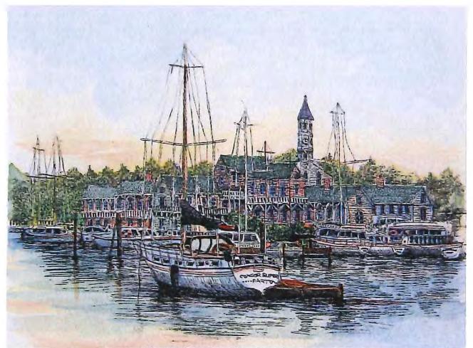
B-72 ニューポートⅢ(ロードアイランド、アメリカ) 《エッチング+手彩色》