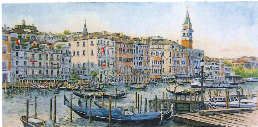
H-11 ザ・ベニスXIV (イタリア) 《エッチング+手彩色》