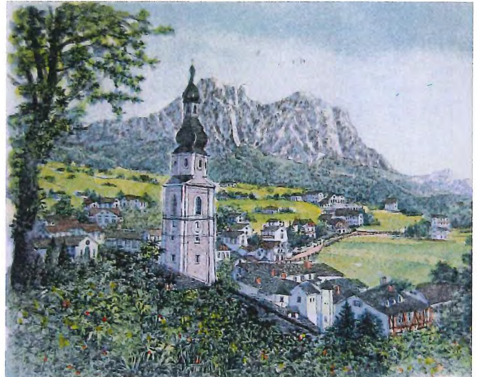
B-70 カステロットⅡ, ドロミテ(イタリア) 《エッチング+手彩色》