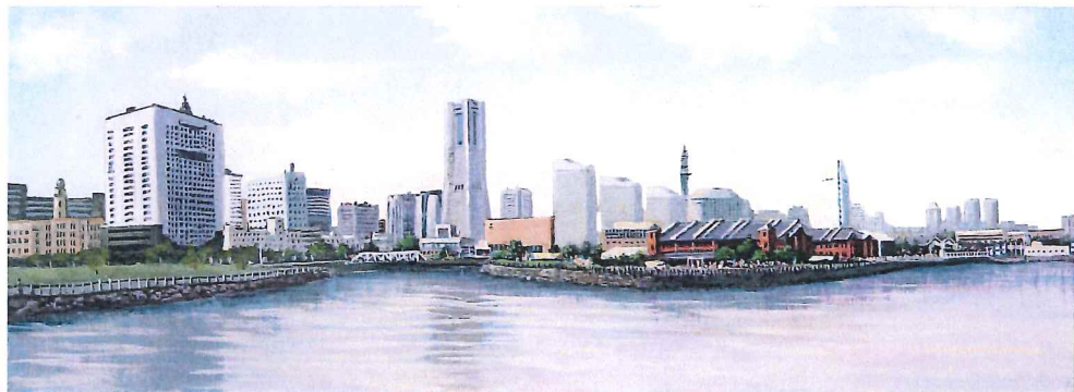
F4W-03 みなとみらいⅢ 《キャンバスジグレー+メディウム仕上げ》