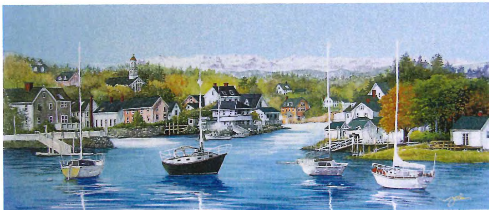
HX-03 ザ・ニューイングランドⅢ (アメリカ) 《ジクレ+メディウム仕上げ》