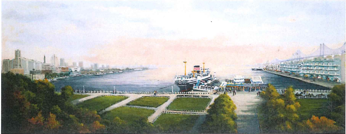
F6W-02 ザ・ヨコハマⅣ 《キャンバスジグレー+メディウム仕上げ》