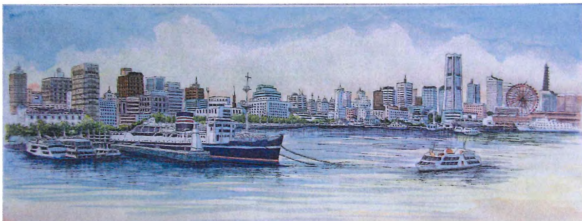
PA-04 横浜港と氷川丸VI 《エッチング+手彩色》