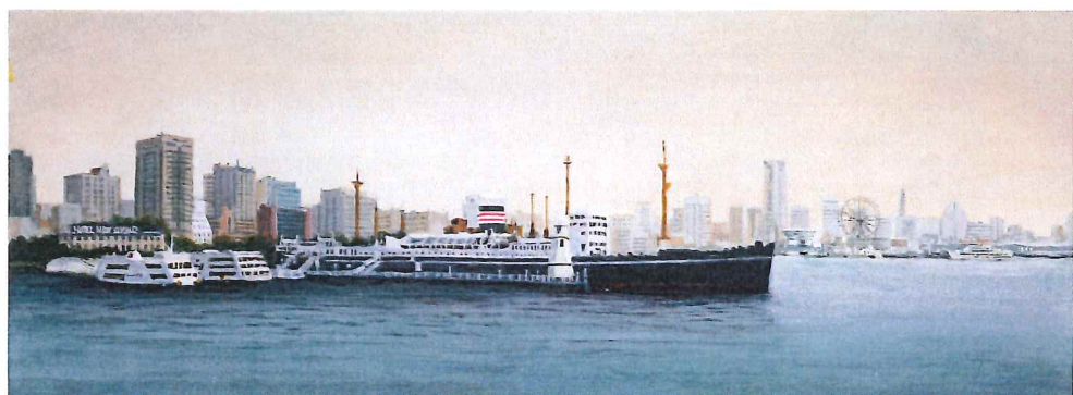
F4W-01 横浜港と氷川丸Ⅶ 《キャンバスジグレー+メディウム仕上げ》